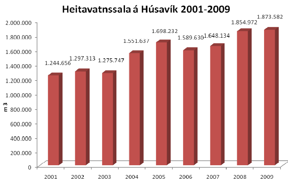
Mynd 1: Heitavatnssala á Húsavík árin 2001 til 2009, mæld í m 3

Þrír bæir í Kinn tengdust hitaveitu á árinu.