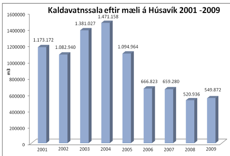
Mynd 2: Kaldavatnssala eftir mæli á Húsavík árin 2001 til 2009, mæld í m 3

Því er eins farið með kaldavatnssölu um mæli og heitavatnssölu sem bæði hafa því sem næst staðið í stað. Endurspeglar þetta umsvif fyrirtækja á staðnum sem staðið hafa í stað síðustu ár, sjá mynd 2.